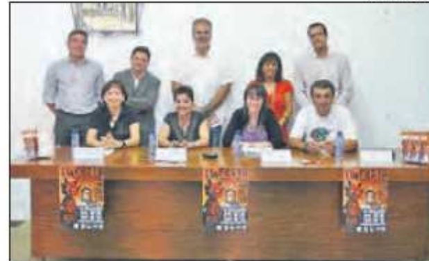
Imatge dels Mecenes que promocionen la festivitats